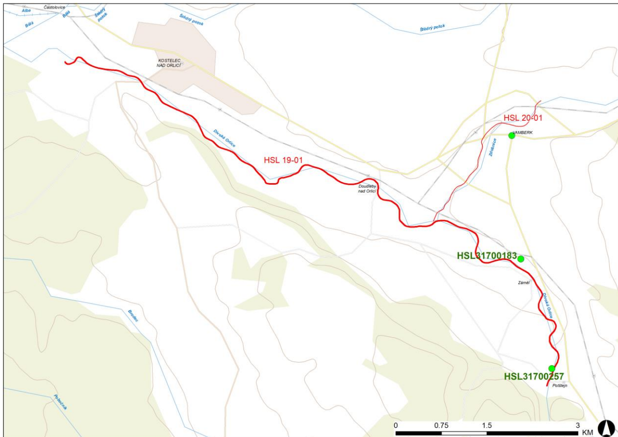
Obr. 3 Přehledná mapa lokalizace navrhovaných opatření s identifikátorem – listem opatření (ID OP)