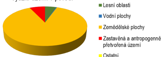
Využití území v povodí